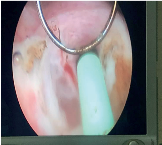
Figura 1: Resección endoscópica de rodete vesical