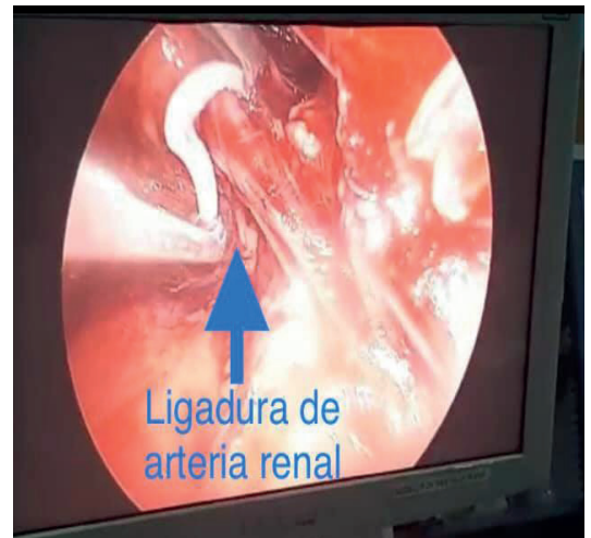
Figura 3: Control vascular, ligadura de arteria y vena renal

en arteria y se corta ( ver figura 3 ), se procede a traccionar uréter, y se procede a desincertar uréter en su totalidad, se realiza ampliación de incisión de puerto inicial, disección miofiláctica hasta retroperitoneo, se extrae riñón a través de incisión ( ver figura. 4 ), se revisa hemostasia, se deja drenaje tubular en lecho quirúrgico y se procede al cierre de incisión con Vicryl 1-0 surgete y piel con puntos Sarnoff 3-0, se verifica hemostasia, se coloca 2 Gelfoams en hilio, se retiran puertos, se afronta fascia dorsolumbar con Vicryl del 1-0, se afronta piel con Nylon 3-0 puntos simple, se cubren heridas quirúrgicas